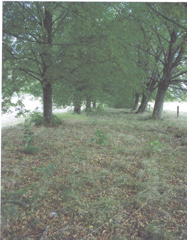
27. Senojo kelio fragmentas tarp šurfių Nr.4 ir 5, iš P pusės