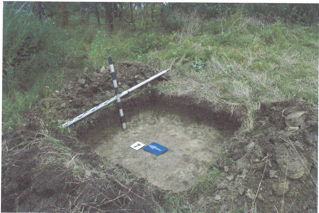
42. Šurfas Nr.7, g.0,4 m, iš V pusės