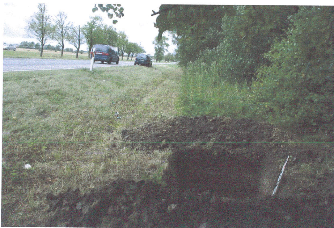
35. Šurfas Nr.5, g. 0,9 m, iš P pusės