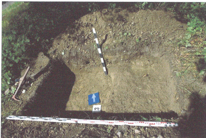
16. Šurfas Nr.3, 0,6 m, iš P pusės