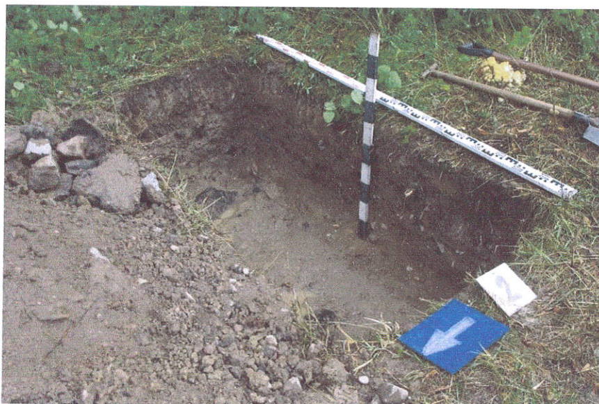
10. Šurfas Nr.2 , g. 0,7 m, iš ŠV pusės