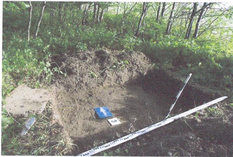
14. Šurfas Nr.3, 0,4 m, iš P pusės