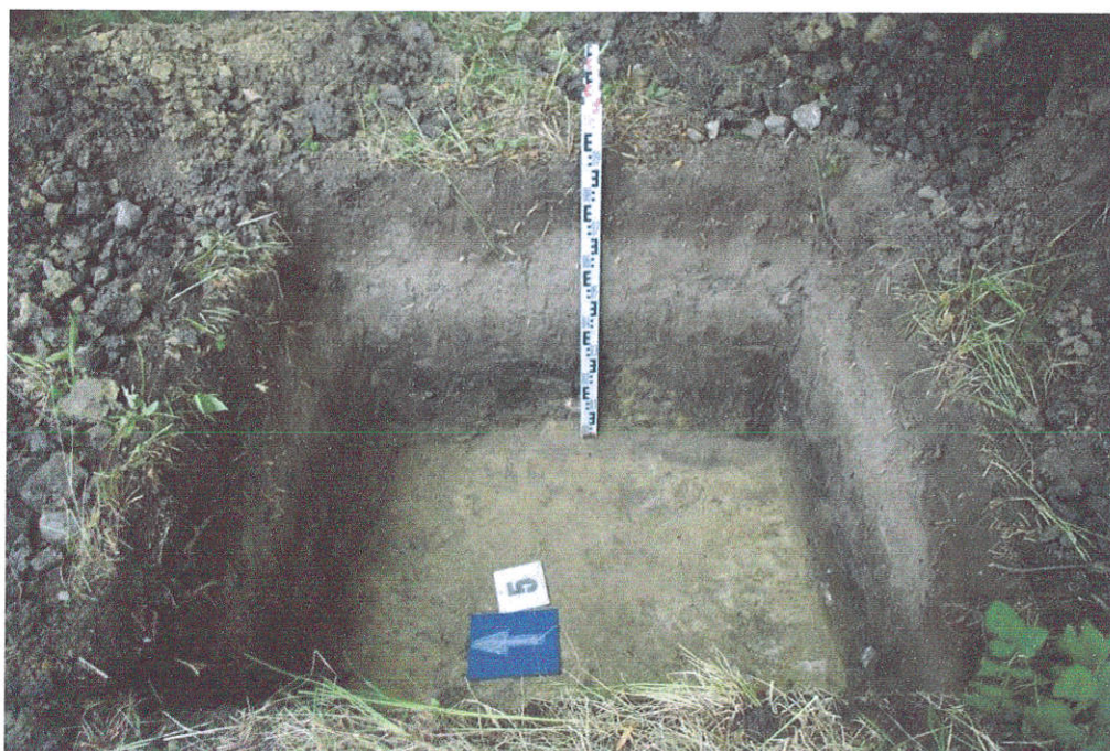
33. Šurfas Nr.5, g. 0,9 – 1,0 m, išV pusės