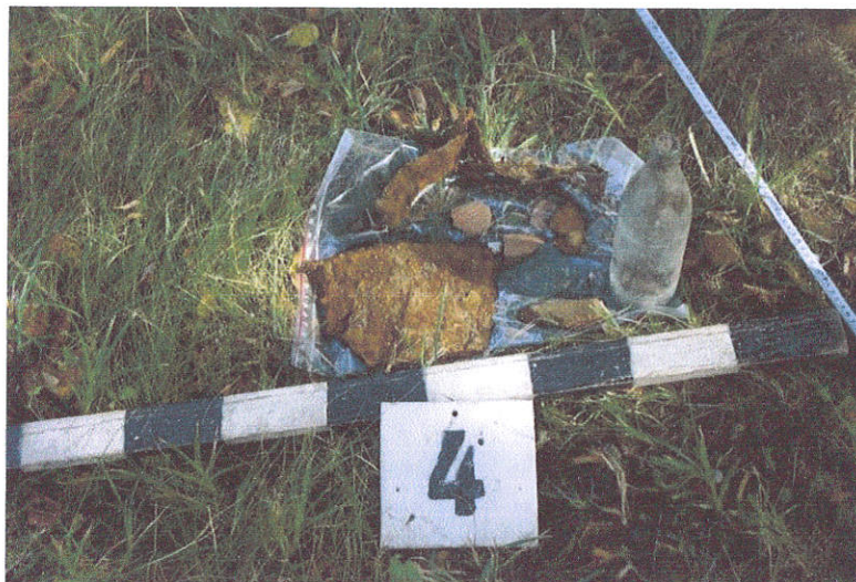
22. Šurfe Nr.4 rasti XX a. radiniai: stiklinis butelis, ketinio puodo fragmentas,