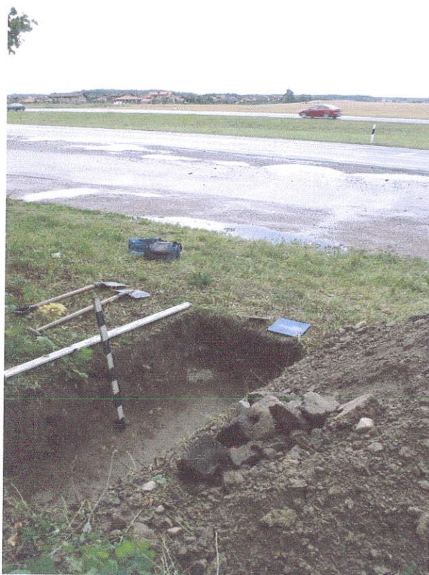
11. Šurfas Nr.2 , g. 0,7 m, iš ŠR pusės