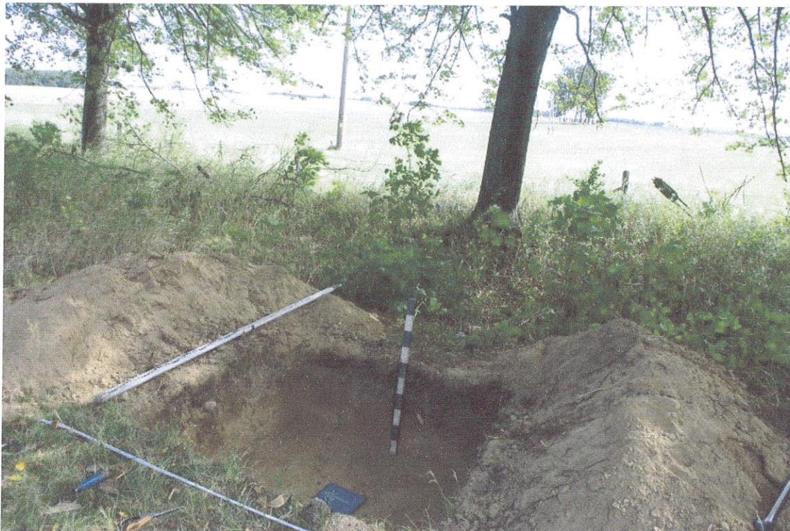
25. Šurfas Nr.4, g. 0,4 m, iš PV pusės