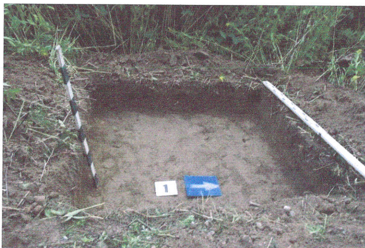
3. Šurfas Nr.1, g. 0,3-0,4 m, iš R pusės