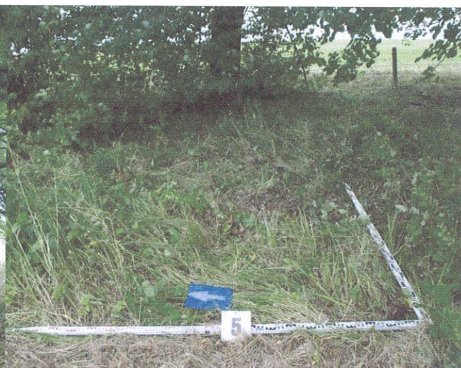
28. Šurfo Nr.5 situacija, iš V