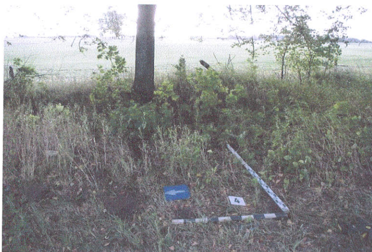
19. Šurfo Nr.4, situacija, iš V pusės