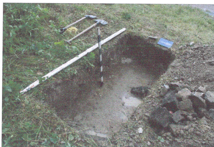
9. Šurfas Nr.2, g. 0,7 m, iš ŠR pusės