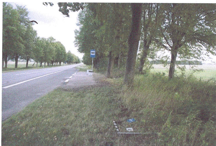
20. Šurfo Nr.4 situacija, iš P pusės