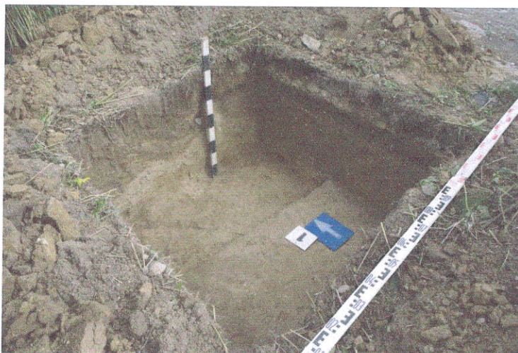
4. Šurfas Nr.1, g.0,7 - 0,9 m, iš PR pusės