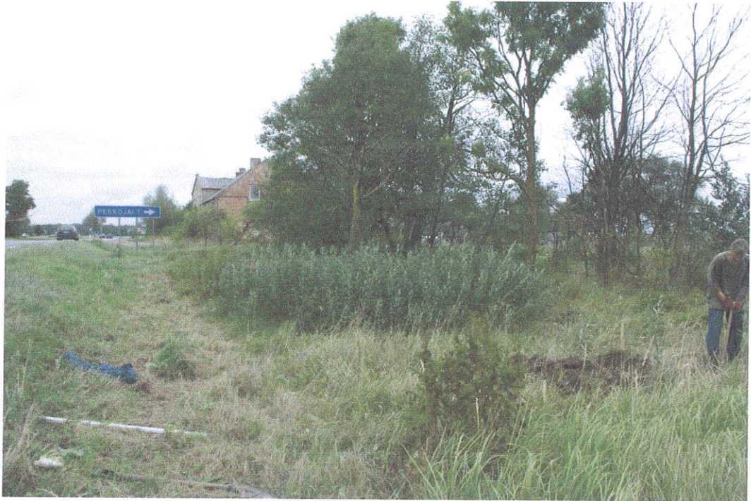
41. Šurfas Nr.7, ties Karklės – Peskojų sankryža, iš P pusės