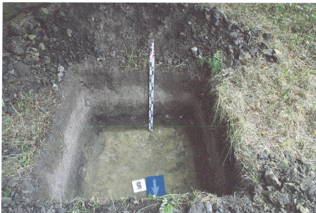
31.Šurfas Nr.5, g. 0,9 m, iš Š pusės