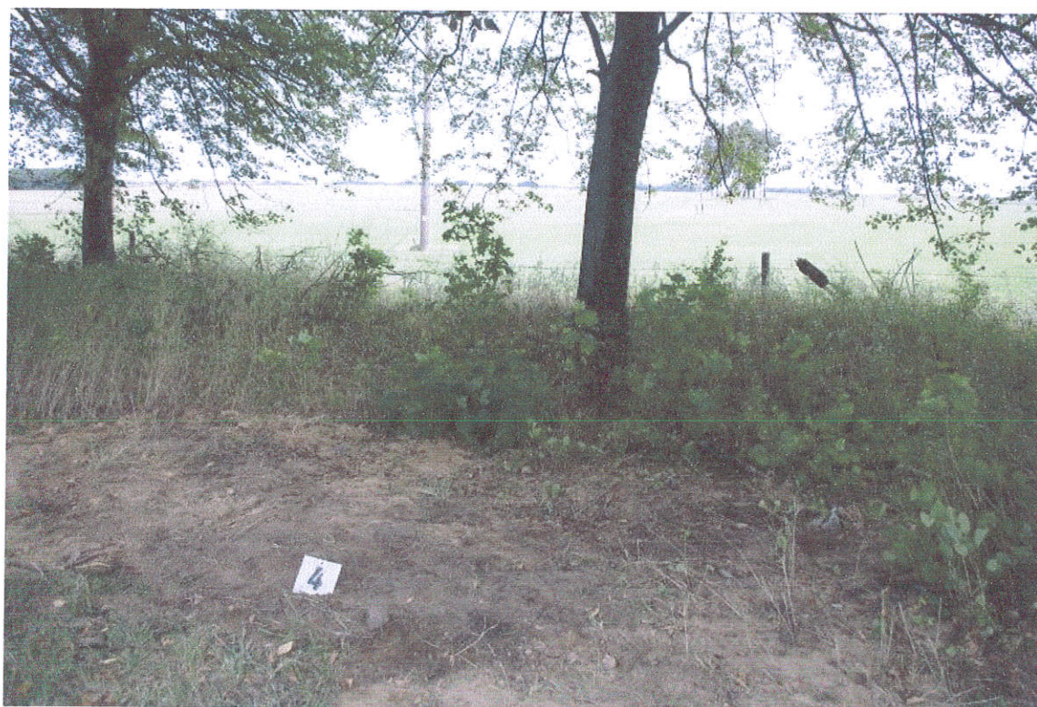
26. Užverstas šurfas Nr.4, iš V pusės