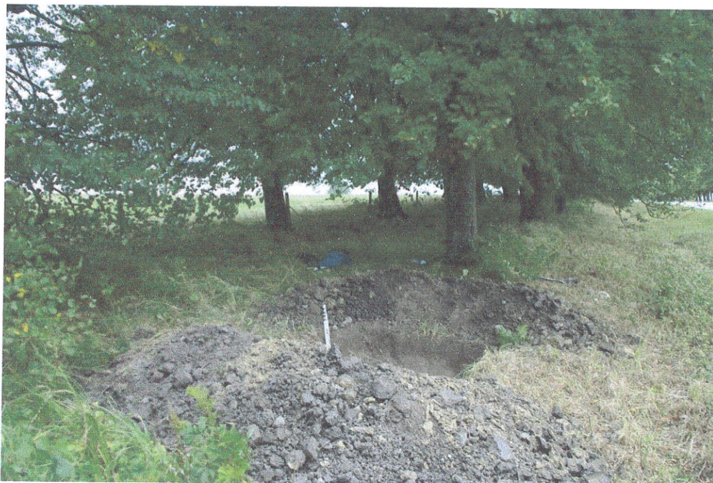
34. Šurfas Nr. 5, g. 0,95 m, iš Š pusės