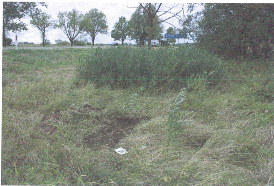
40. Šurfo Nr.7 situacija, iš PR pusės