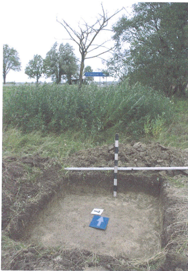
43. Šūrfas Nr.7, g.0,4 m, iš P pusės