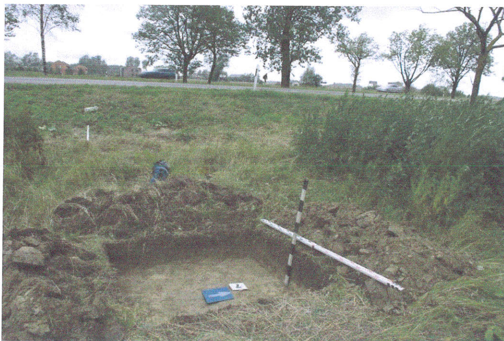
44. Šūrfas Nr.7, g.0,4 m, iš PV pusės