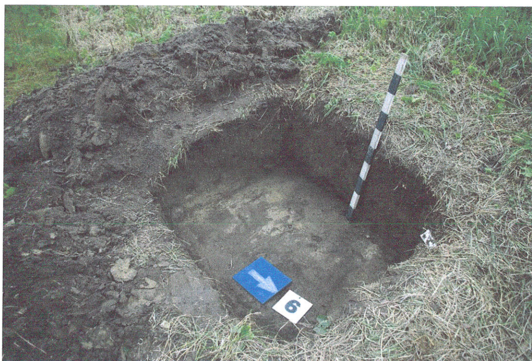
37. Šurfas Nr.6 , g. 0,4-0,6 m, iš ŠR pusės