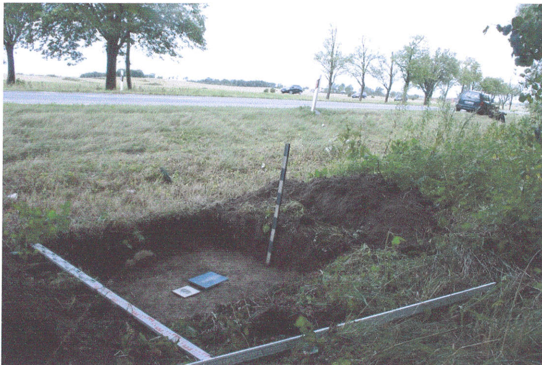
30. Šurfas Nr.5, g. 0,4 m, iš Š pusės