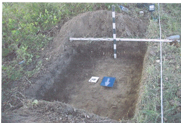
21. Šurfas Nr.4, g. 0,4 m, iš Š pusės