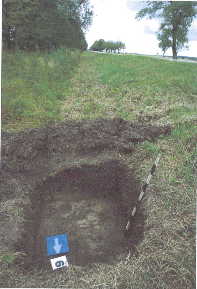
38. Šurfas Nr.6, g.0,4 - 0,6 m, iš Š pusės