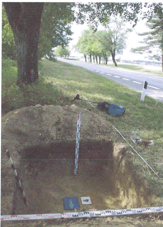
23. Šurfas Nr.4, g. 0,7 m, iš Š pusės