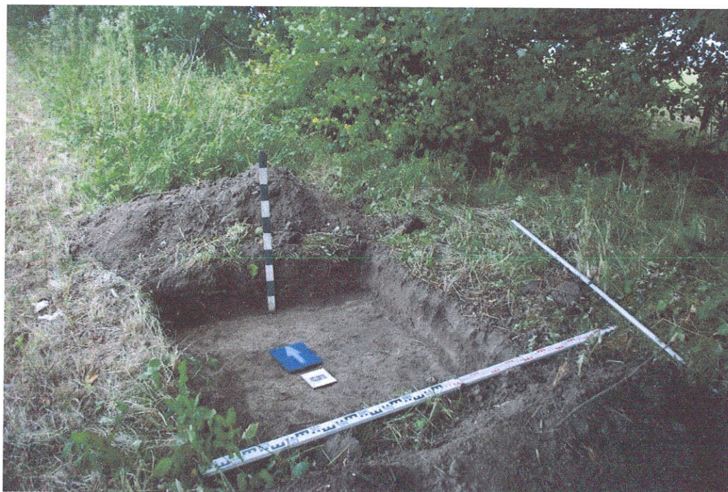
29. Šurfas Nr.5, g.0,4 m, iš PV pusės