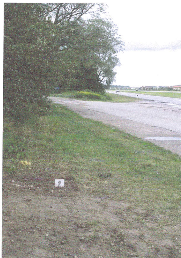
12. Užverstas šurfas Nr.2, iš ŠR pusės