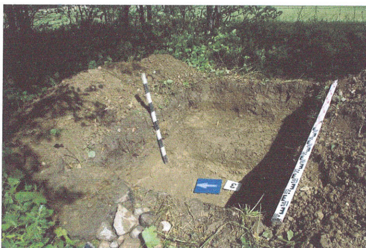
17. Šurfo Nr.3, 0,4 m, iš P pusės