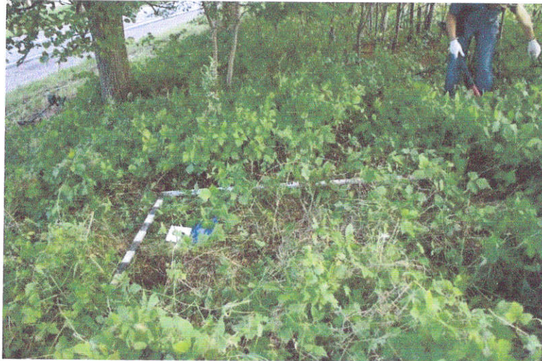
13. Šurfo Nr.3 situacija, iš P pusės