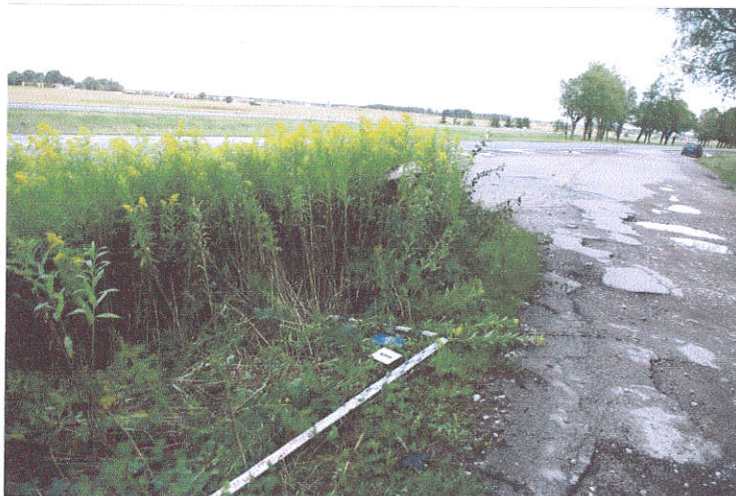
2. Šurfo Nr.1 situacija, ties Zeigių sankryža, iš P pusės