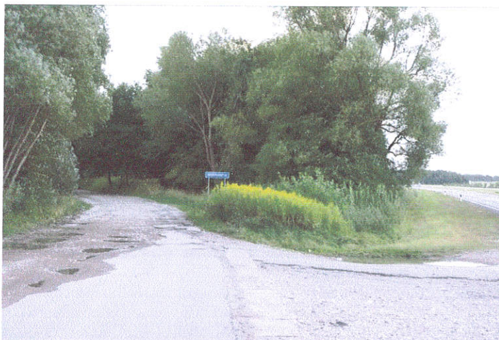
1. Šurfo Nr.1 situacija, ties Zeigių sankryža, iš Š pusės