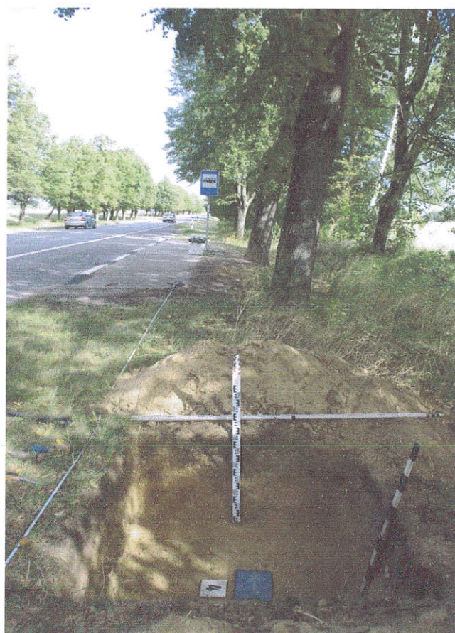
24. Šurfas Nr.4, g. 0,7 m, iš P pusės