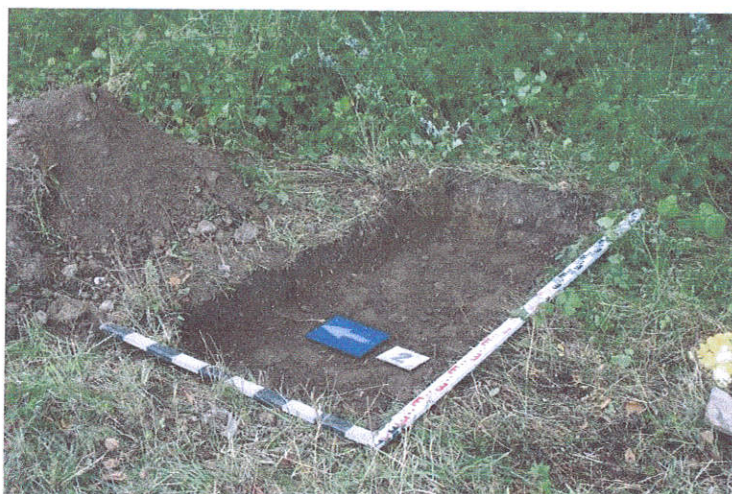
8.Šurfas Nr.2, g. 0,2-0,3 m, iš PV pusės