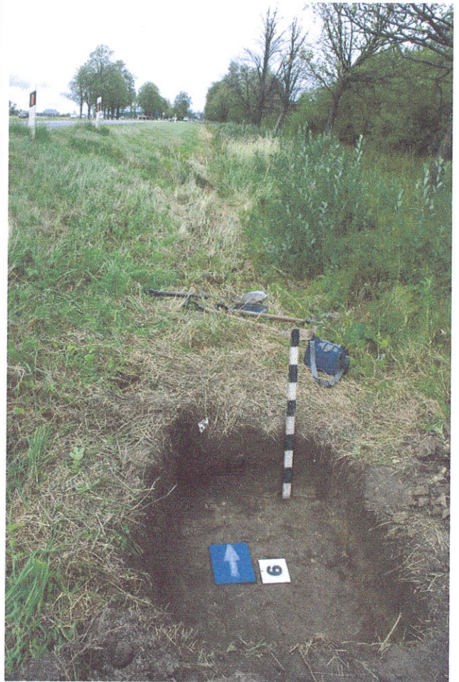
39. Šurfas Nr.6, g.0,4-0,5 m, iš P pusės