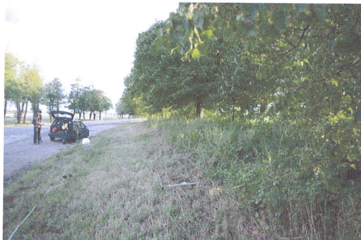
7.Šurfo Nr.2 situacija, iš P pusės