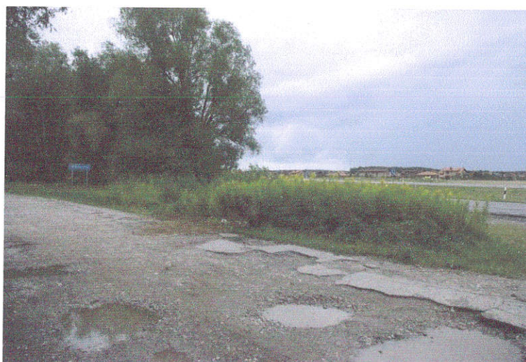
6. Užverstas šurfas Nr.1, iš ŠR pusės