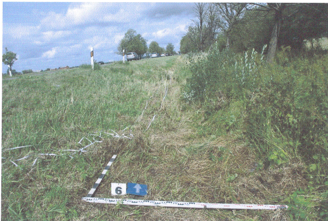
36. Šurfo Nr.6 situacija, iš P pusės