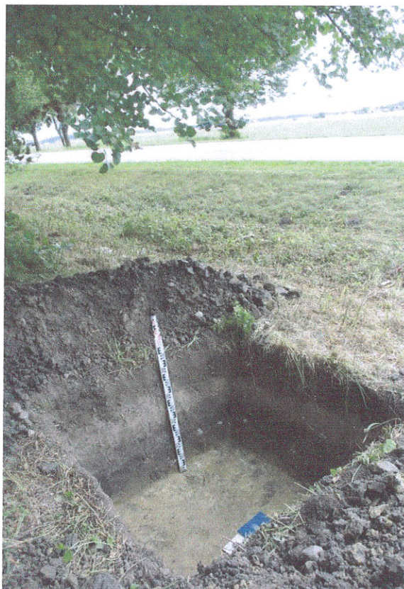
32. Šurfas Nr.4, g. 0,9 – 1,0 m, , iš Š pusės