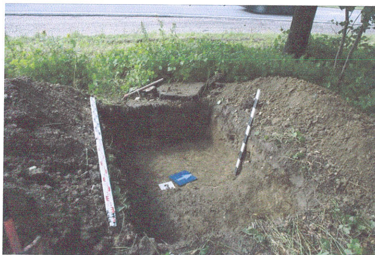
15. Šurfo Nr.3, 0,4 m, iš P pusės